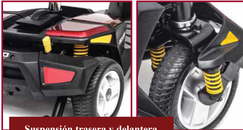
Suspensión trasera y delantera