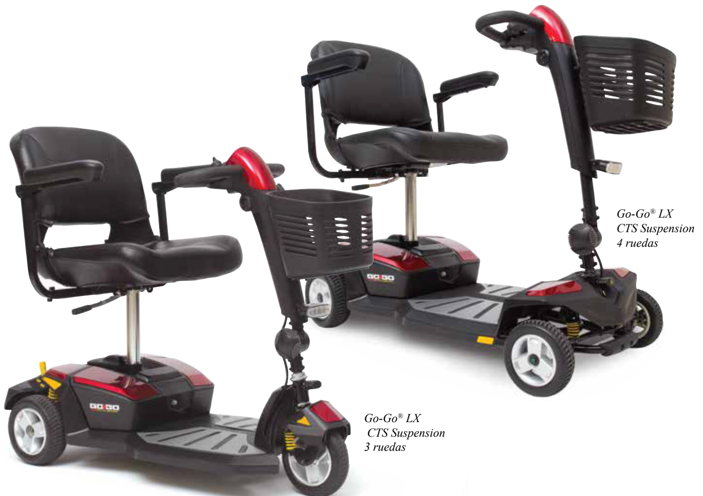
Go-Go ® LX CTS Suspension 4 ruedas

The Go-Go ® LX con CTS (ConfortTrac Suspensión) aporta un nuevo nivel de características de rendimiento y valor para viajar. Con CTS delantera independiente y suspensión trasera, estilo elegante, fácil desmontaje y la iluminación estándar, el Go-Go LX con CTS. Es el scooter de viaje con suspensión más avanzado disponible.